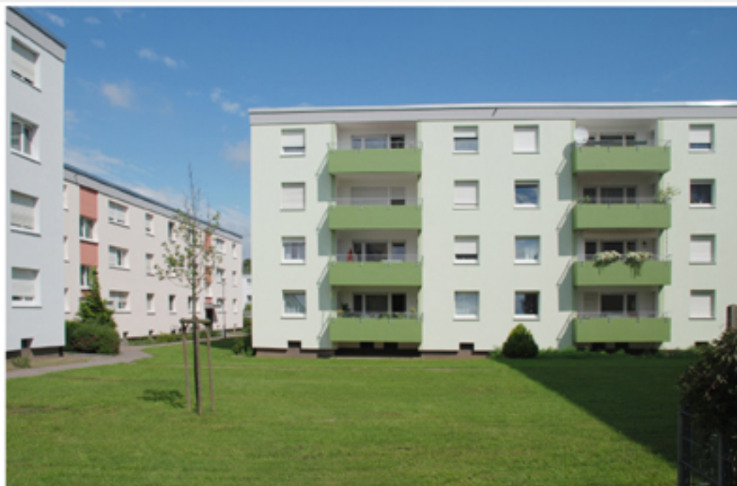
Hofansicht Haus 12