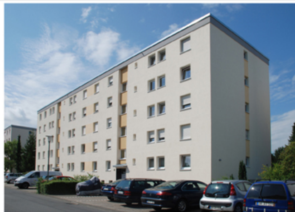
Straßensicht Haus 16/16a