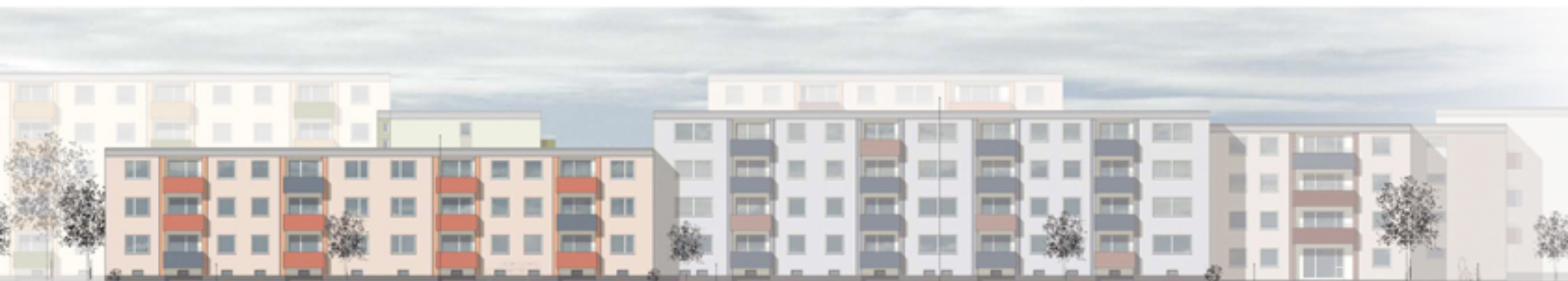
Koblenzer Str. 10/10a, 8/8a