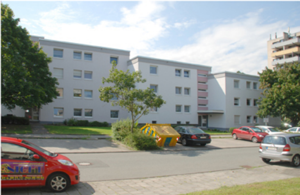
Strassenansicht Haus 11/13