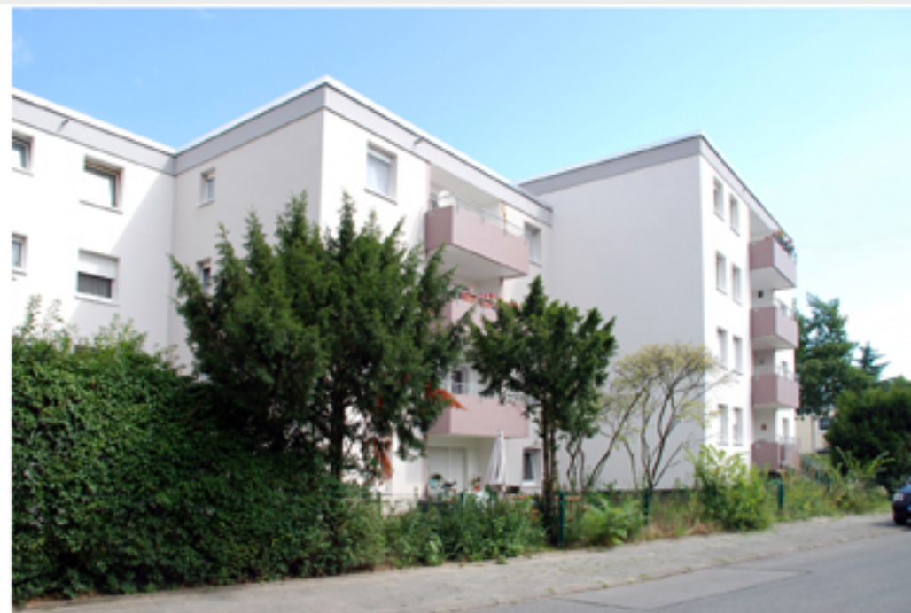
Straßenansicht Haus 6/6a