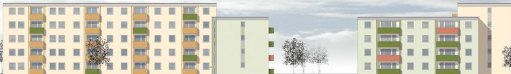
Kölner Straße 16/16a, 12