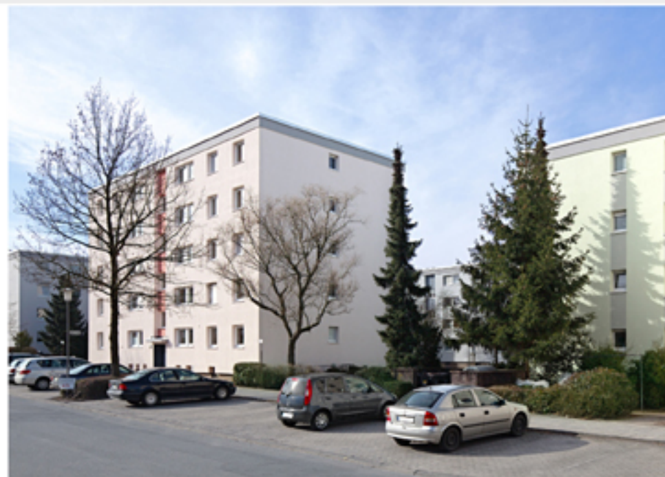
Straßenansicht Haus 14