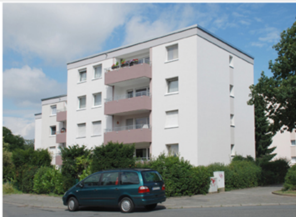
Straßenansicht Haus 6/6a