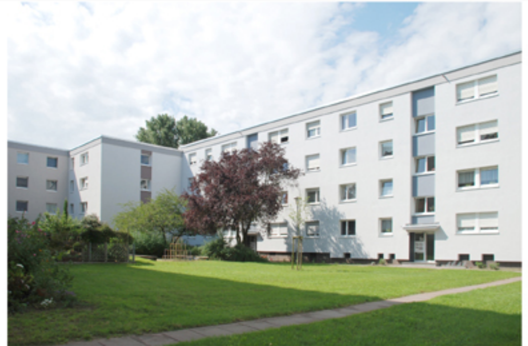
Hofansicht Haus 8/8a