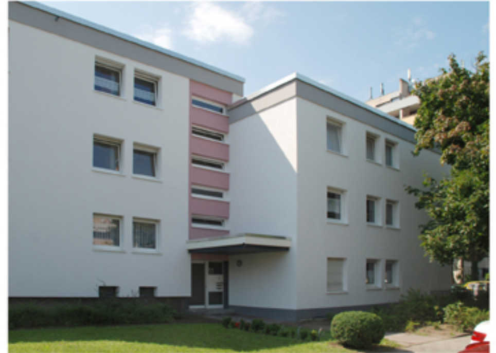
Eingangsbereich Haus 13