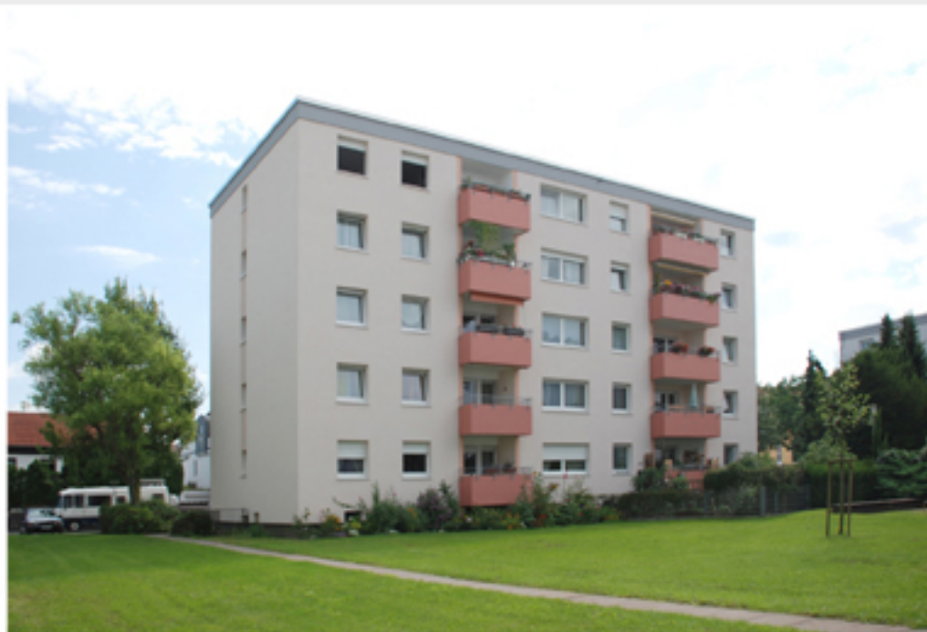
Hofansicht Haus 14