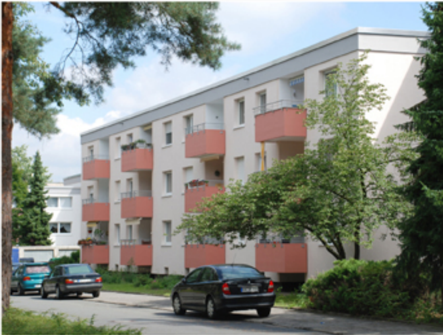
Straßenansicht Haus 10/10a